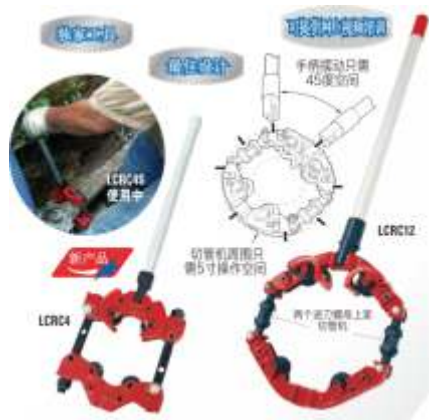
小空间旋转式切管机